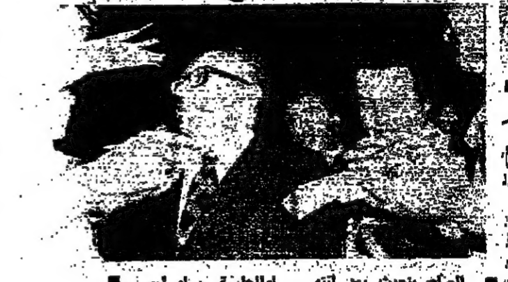
الملك خالد والبطريرك الاسي الرابع يوسطان، والطران خضر، والطران زهير، والكراترة زريل، وابو حيدر وطعمة في جدة امس

وقد اتحدنا يقابل السادات والاسد والقذافي تالت وكالة «الشرق الاوسط» في ثاباها من القاهرة أمس، أنه تقرر أن يلتقي الرئيس الور السادات بوفد موسع من مجلس الأمة الاتحادي يوم السبت المقبل، بناء على توصية انقضا المجلس في الاسبوع الماضي. وأوضحت أنه سيتم في اللقاء بحث البقية على ص - عود ٢ -